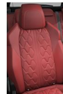
Tapicerka skórzana Nappa Rouge