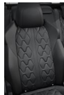
*Tapicerka skórzana Nappa Mistral