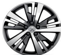
18" 'Detroit' Onyx Black