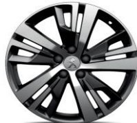
18" 'Detroit' Storm Grey