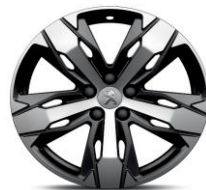
18" 'Los Angeles'