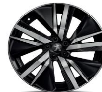
19" 'San Francisco'