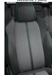
Tapicerka półskórzana Colyn Mistral