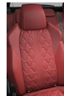
Tapicerka skórzana Nappa Rouge