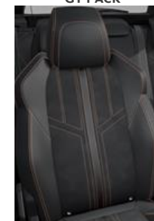
Tapicerka półskórzana Mistral + Alcantara