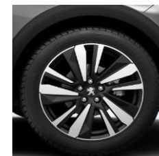
19" 'San Francisco'