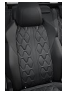
*Tapicerka skórzana Nappa Mistral