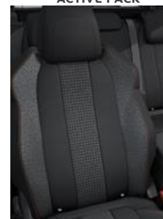
Tkanina Meco Mistral