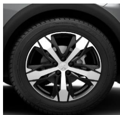
18" 'Los Angeles'