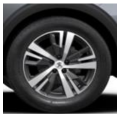
18" 'Detroit' Storm Grey