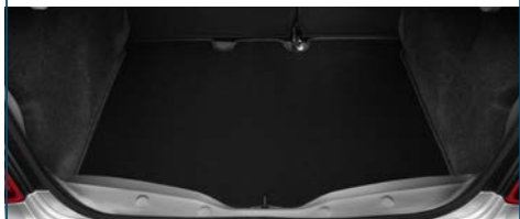
WYKŁADZINA BAGAŻNIKA DWUSTRONNA