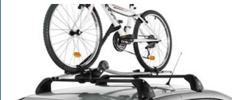
UCHWYT NA ROWER FREERIDE