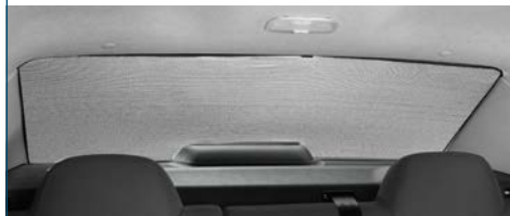
ZASŁONA PRZECIWSŁONECZNA TYLNA