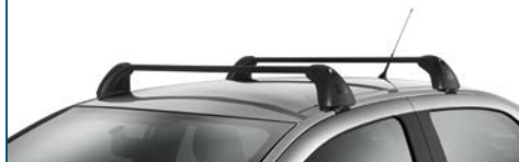
BELKI POPRZECZNE BAGAŻNIKA DACHOWEGO