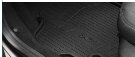
KOMPLET DYWANIKÓW MATERIAŁOWYCH/GUMOWYCH