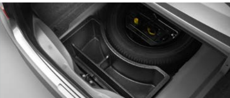
SCHOWEK DO WNĘKI KOŁA ZAPASOWEGO